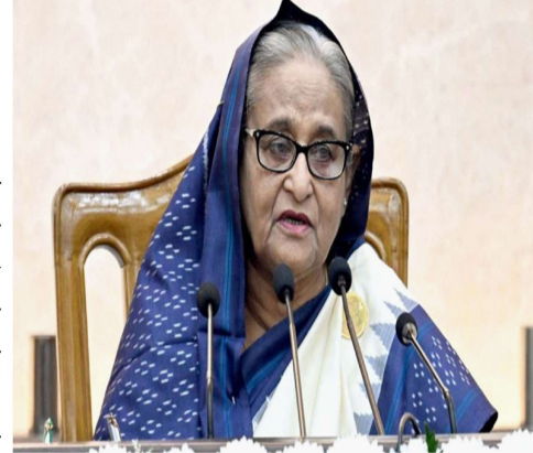
राजधानी ढाकाको एक उपनगरमा आकर्षक

बंगलादेशको एक अदालतले पूर्वप्रधानमन्त्री शेख हसिना र संयुक्त राष्ट्रसंघको उच्च अधिकारीका रूपमा काम गरिसकेकी उनकी छोरीसहितको परिवारविरुद्ध भ्रष्टाचार विरोधी संस्थाले दायर गरेको मुद्दामाथि सोमबार सुनुवाई गरेको छ। सुनुवाईका क्रममा भ्रष्टाचार निरोधी आयोग (एसीसी) का तीन जना अधिकारीहरूले